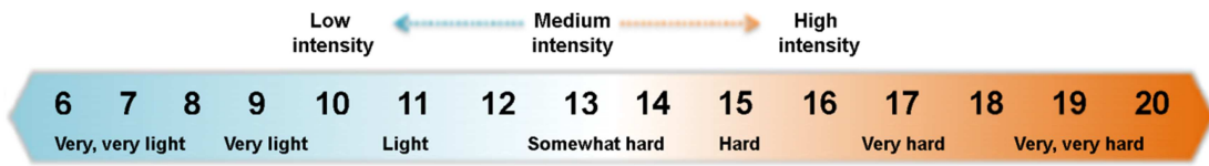
Figure 3. Rate of Perceived Exertion (RPE)