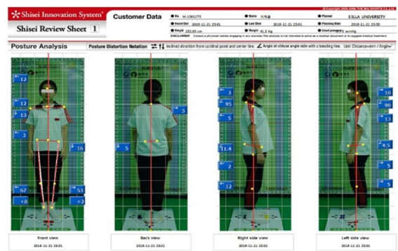
Figure 1. PA200 (Shisei Innovation System, Japan)